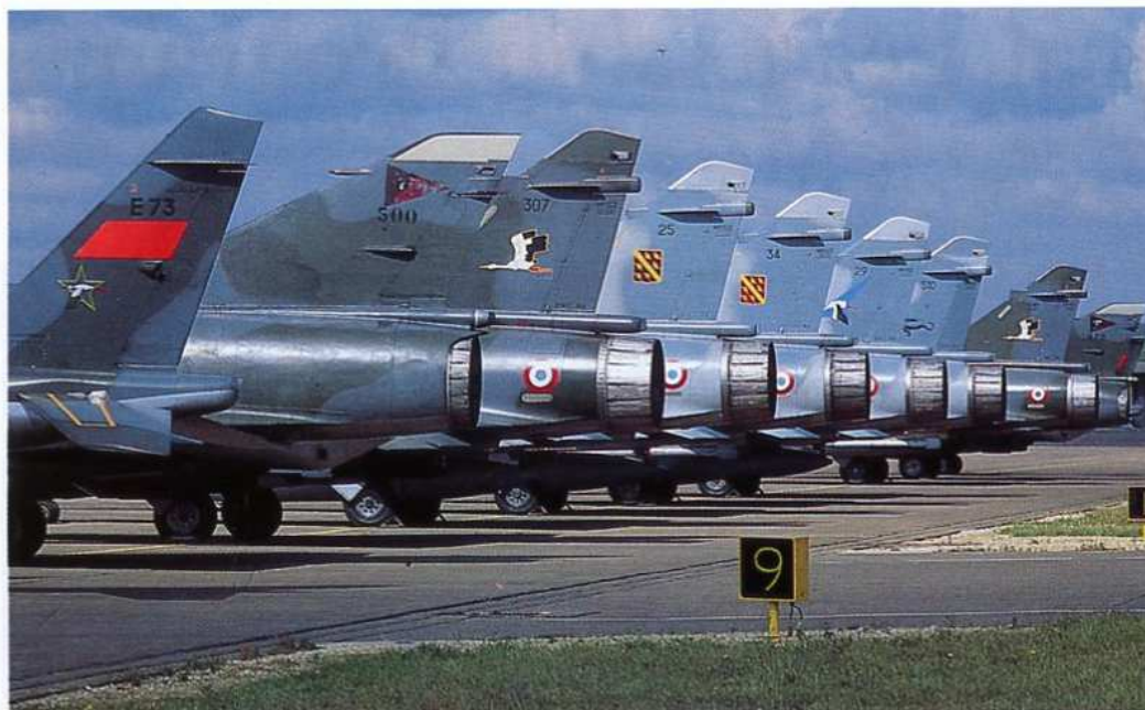
Sirpa Air (Adc. J.P. Gauthier)