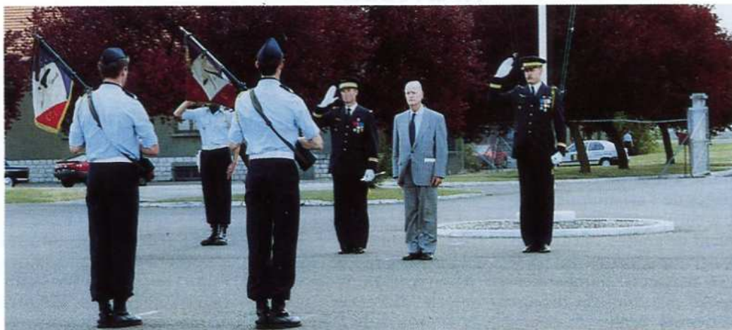
Sirpa Air (Adc. J.P. Gauthier)

Notons également qu'à l'occasion de cette cérémonie le commandant Fullenwarth a succédé au commandant Garrot au commandement du Groupe d'entretien et de réparation des matériels spécialisés.