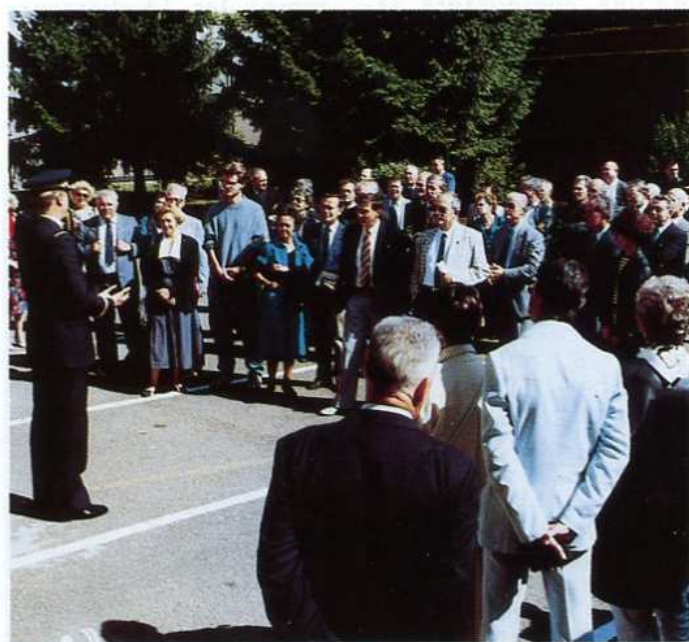
Sirpa Air (Adc. J.P. Gauthier)