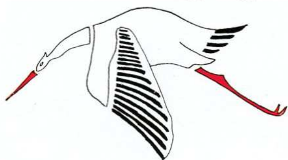
SPA 3 Cigogne de Guynemer.