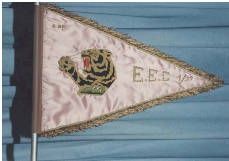
Revers du fanion

Par lettre n° 428 du 21 juillet 1953, le SHAA émet un avis favorable.