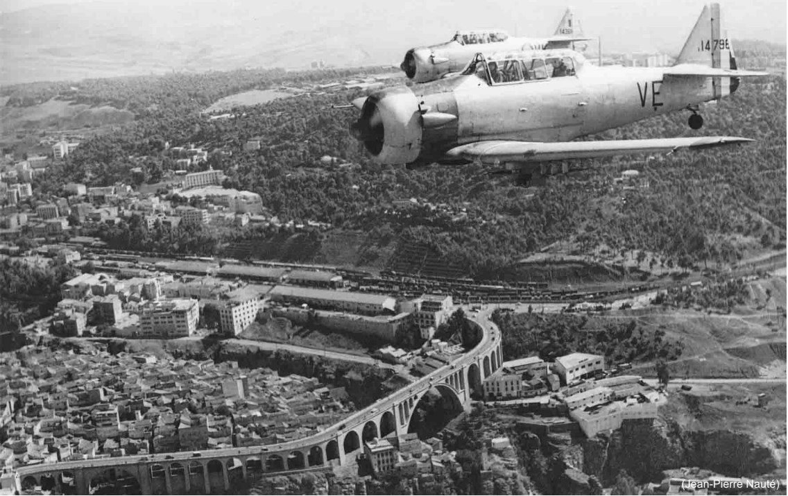
EALA 18/72 – Constantine, 1958