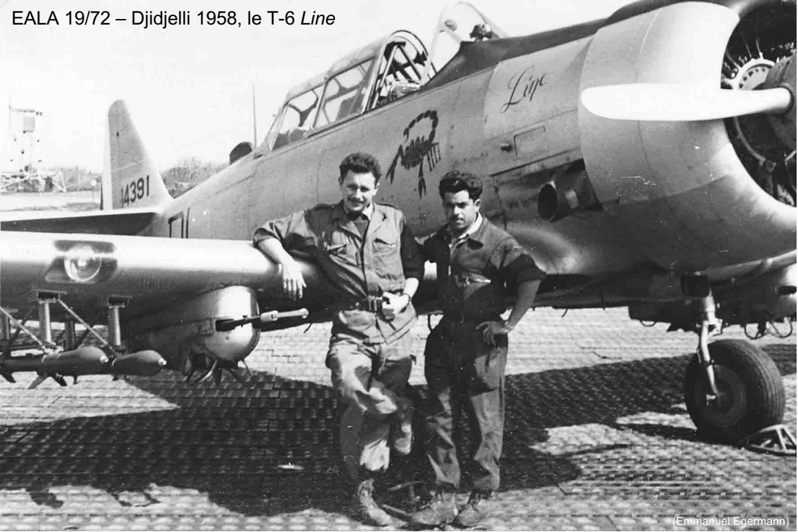
EALA 19/72 – Djidjelli 1958, le T-6 Line