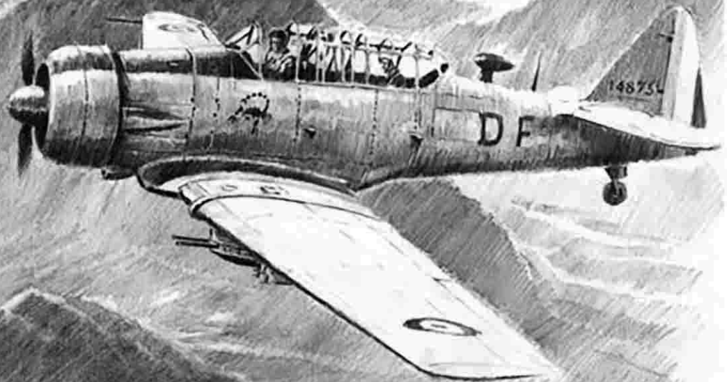
EALA 19/72 – Région de Sétif, 1960