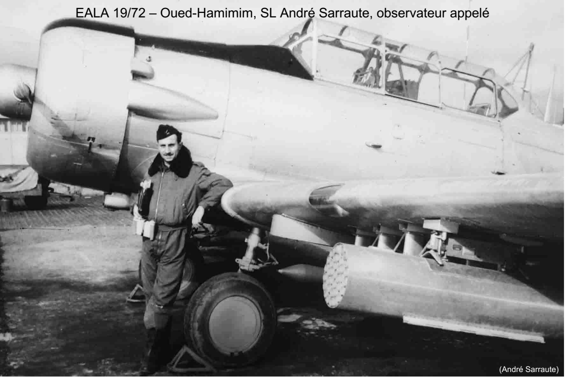
EALA 19/72 – Oued-Hamimim, SL André Sarraute, observateur appelé