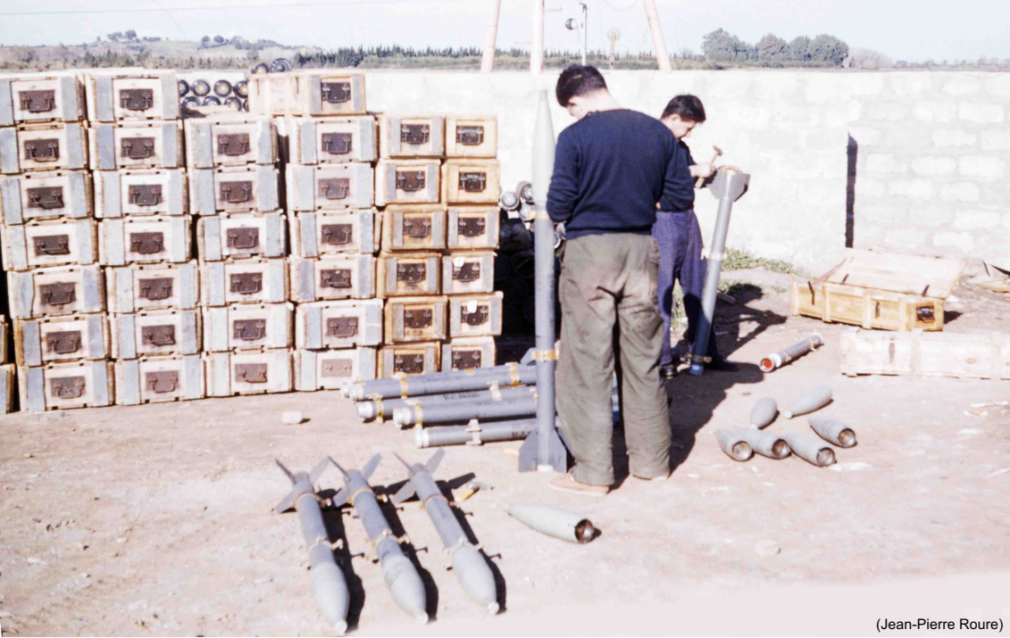
EALA 19/72 – Djidjelli 1958, montage des roquettes T10