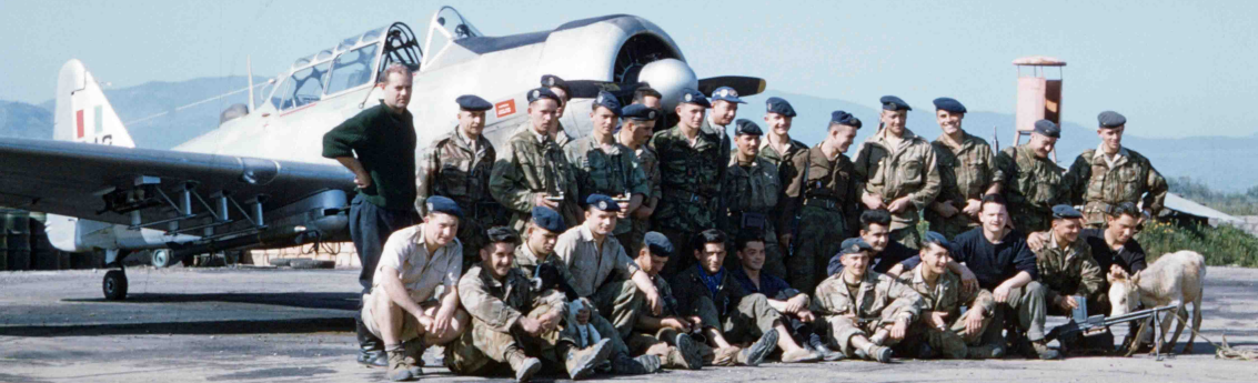
EALA 19/72 – Djidjelli 1958, Parachutistes métro