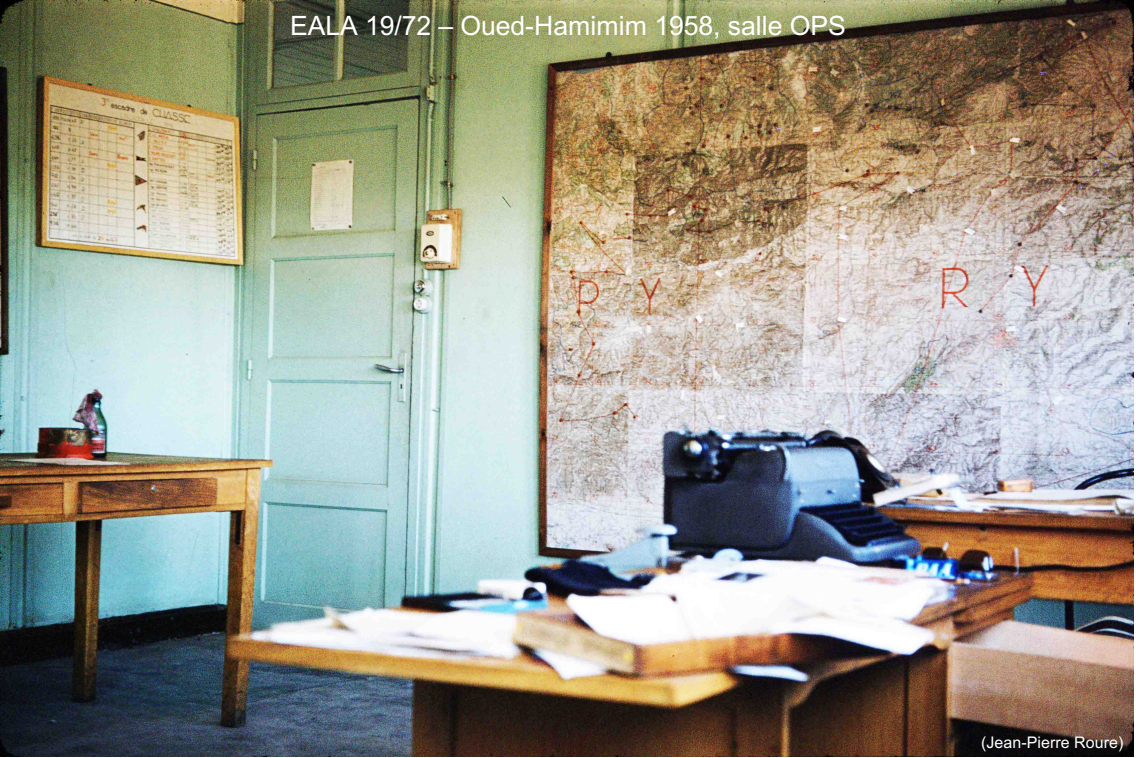
EALA 19/72 – Oued-Hamimim 1958, salle OPS