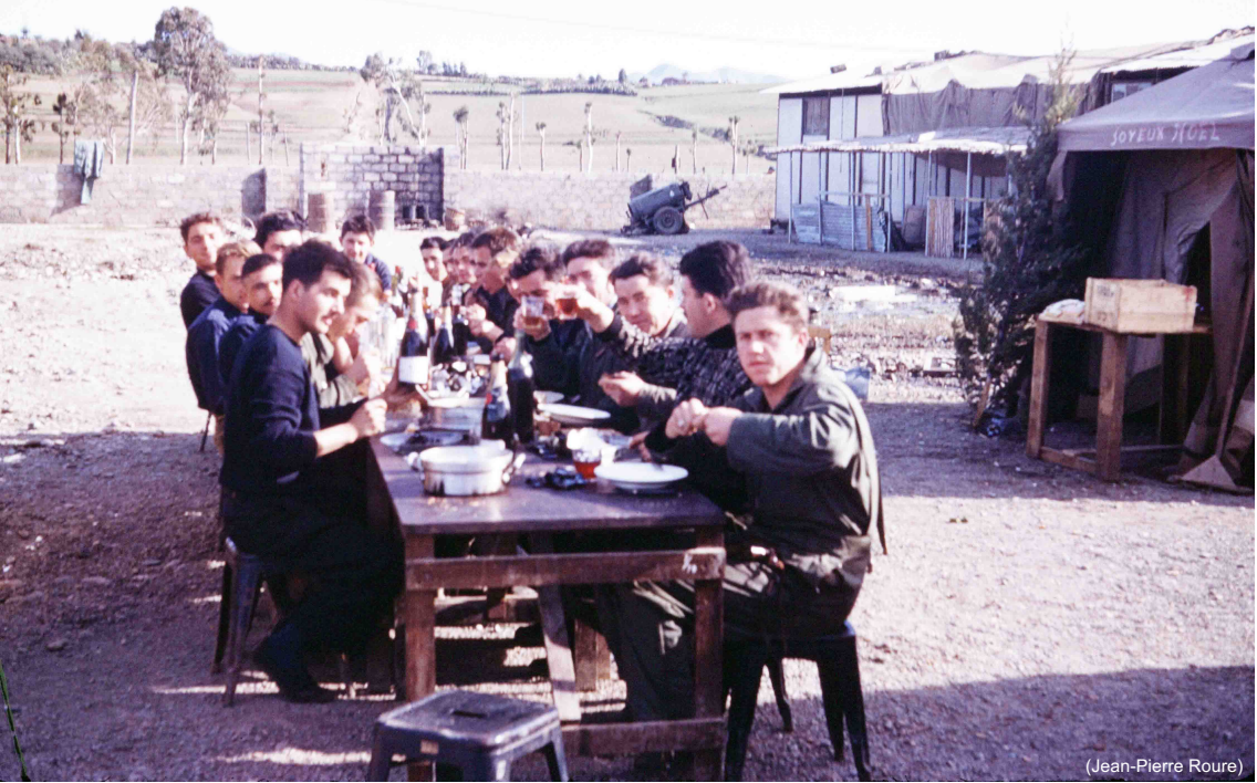
EALA 19/72 – Noël à Djidjelli, 1958