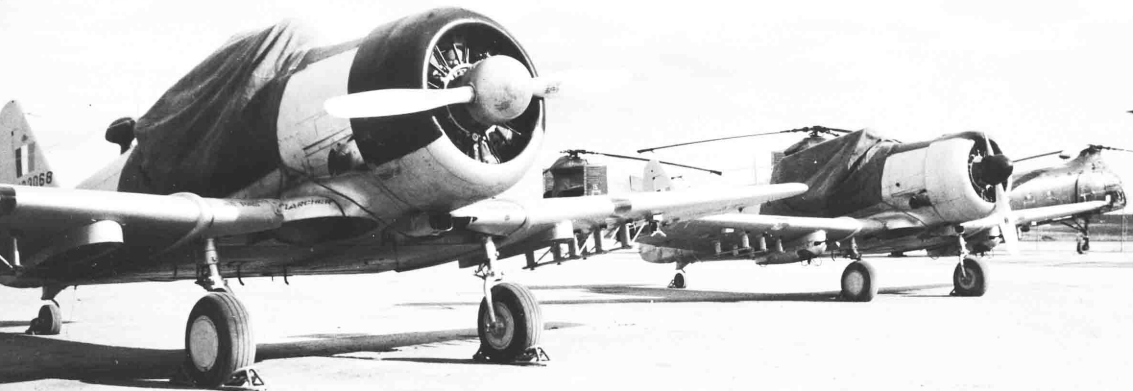
EALA 3/73 – Sidi-Bel-Abbès, 1961, les T-6 en attente d'affectation