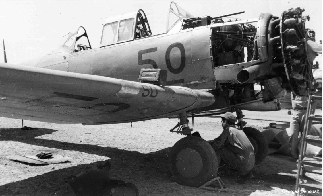
EALA 3/73 – Paul-Cazelles, 1959